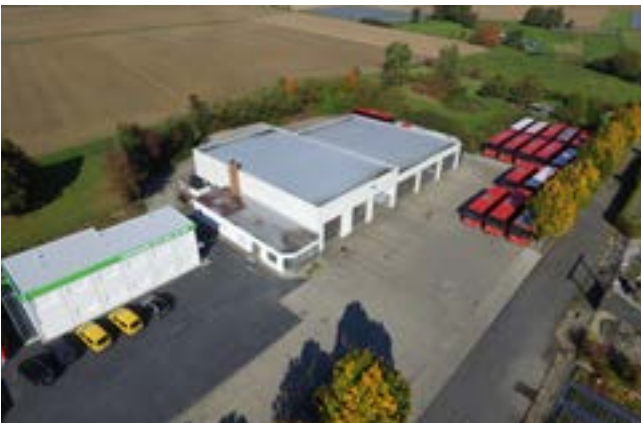
Betriebs Hof Standort Niedenstein