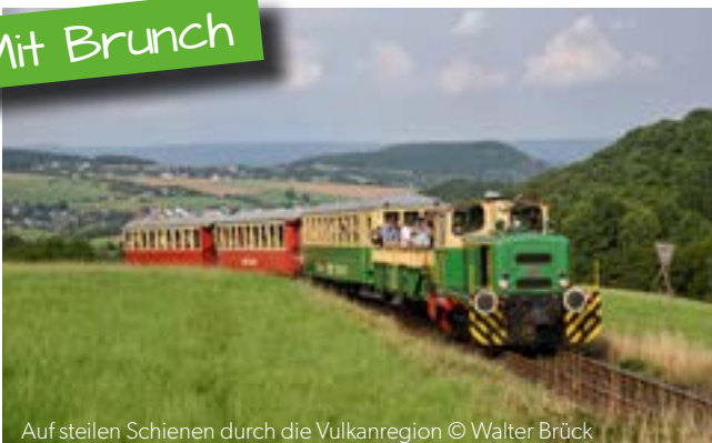
Auf steilen Schienen durch die Vulkanregion