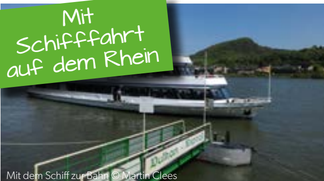
Mit dem Schiff zur Bahn