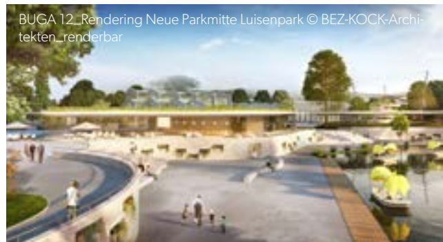
BUGA 12...Rendering Neue Parkmitte Luisenpark © BEZ-KOCK-Architekten_renderbar

Mannheim wird von April bis Oktober 2023 Schauplatz der Bundesgartenschau sein und wird „grüner denn je“. Auf dem großzügigen ehemaligen Kasernengelände „Spinelli-Barracks“ sowie in Teilen des Luisenparks nahe der Mannheimer Innenstadt entsteht eine natürlich bunte Blumen- und Pflanzenschau, eine Ausstellungsfläche zum Thema Städteentwicklung, Klima, Umwelt, Energie und Nachhaltigkeit. Das Highlight: Über eine zwei Kilometer lange Seilbahn über den Neckar sind die beiden Ausstellungsflächen miteinander verbunden und diese wird auch über die Bundesgartenschau hinaus als „grüne Verbindung“ bestehen bleiben. Genießen Sie eine wunderbare Aussicht auf unzählige Blumenarrangements, auf ein naturnahes Augewässer vom Panoramasteg sowie ein breites Angebot an Kulturveranstaltungen, Gastronomie, Freizeit- und Sportveranstaltungen.