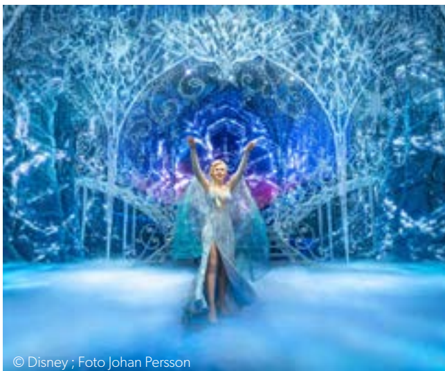
© Disney : Foto Johan Persson