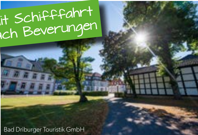
Bad Driburger Touristik GmbH