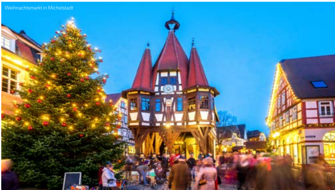
Weihnachtsmarkt in Michelstadt