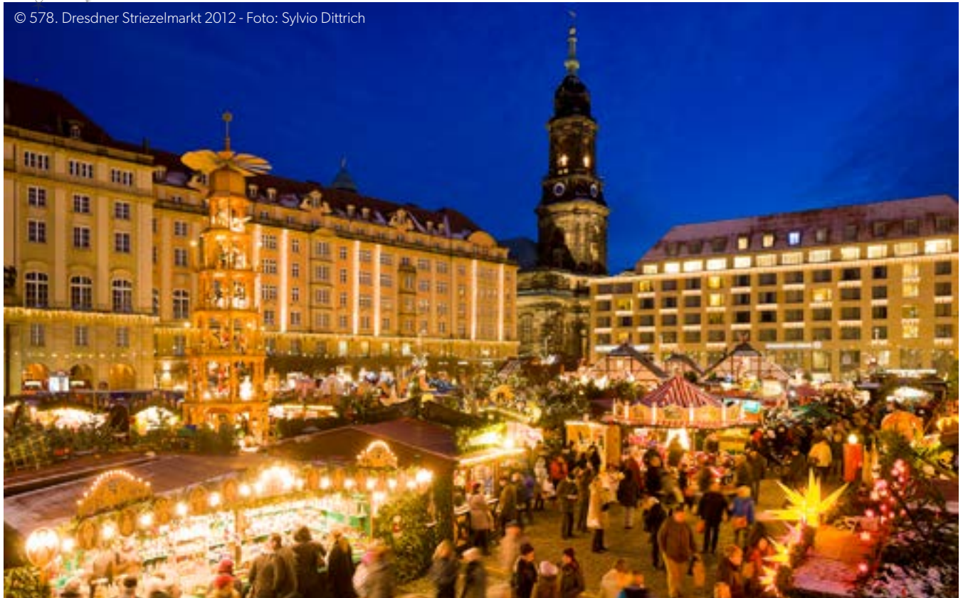
© 578. Dresdner Striezelmarkt 2012 - Foto: Sylvio Dittrich

Der Dresdner Striezelmarkt findet in diesem Jahr zum 588. Mal statt und hat somit schon eine tief verwurzelte Tradition. Die große erzgebirgische Stufenpyramide, der begehbare Schwibbogen sowie ein weihnachtliches Rahmenprogramm stimmen Groß und Klein in die bevorstehende, festliche Adventszeit ein.