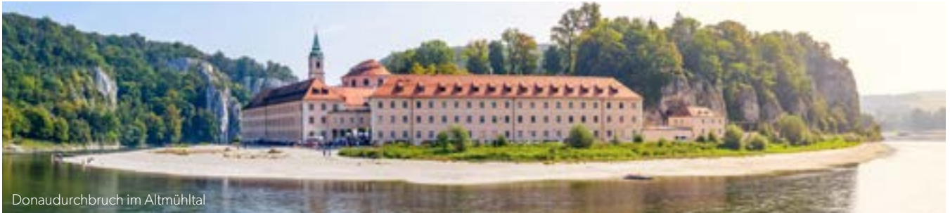
Donaudurchbruch im Altmühltal

Das Altmühltal ist eine vielseitige Genussregion mit abwechslungsreicher Natur und historisch romantischen Ortschaften im Herzen Bayerns. Dieser faszinierende Landstrich beeindruckt mit faszinierenden Nebentälern, mittelalterlichen Burgen und barocken Städten.