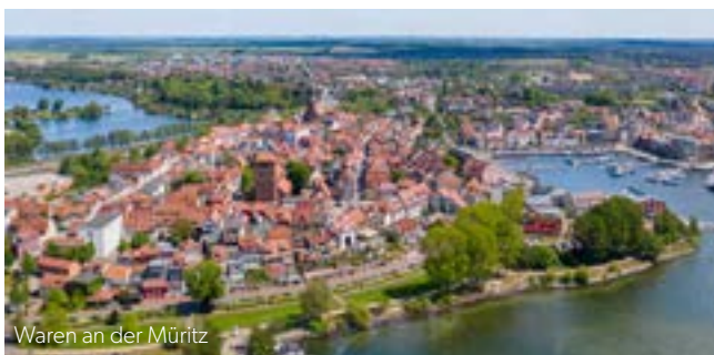
Waren an der Müritz

Natur, Kultur und Religion geben sich am „Kirch-