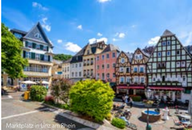
Marktplatz in Linz am Rhein

Das zweite Septemberwochenende hat in Linz am Rhein eine weitreichende Tradition und ist ein absolutes Jahreshighlight: Der Linzer Marktplatz verwandelt sich in ein lauschig, rustikales Weindorf, in welchem regionale Winzer und musikalische Live-Unterhaltung aus Oldies, Volksmusik, Partyklängen, Rock oder Pop für ausgelassene, rheinische Festtagsstimmung sorgen. Gemeinsam mit der Weinkönigin und ihren beiden Prinzessinnen genießen Sie Weine nach Ihrem Geschmack – ganz gleich ob rot, weiß oder rosé.