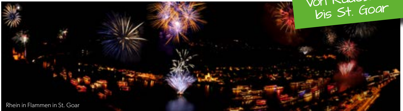
Rhein in Flammen in St. Goar

Schon vom Ufer aus ist Rhein in Flammen ein unvergessliches Erlebnis, aber vom Wasser aus bekommt die Veranstaltung eine ganz neue Perspektive! Am frühen Abend bewegt sich der beeindruckende Schiffs-korso mit bis zu 50 Schiffen durch das romantische Rheintal von Rüdesheim bis St. Goar. An Land wird ein musikalisches und kulinarisches Programm angeboten, welches an Vielseitigkeit kaum zu übertreffen ist. Auf dem Schiff genießen Sie einen wunderbaren Ausblick auf die Uferpromenade und erleben später eine in ein Farbenmeer getauchte Landschaft bei einem magischen Feuerwerk.