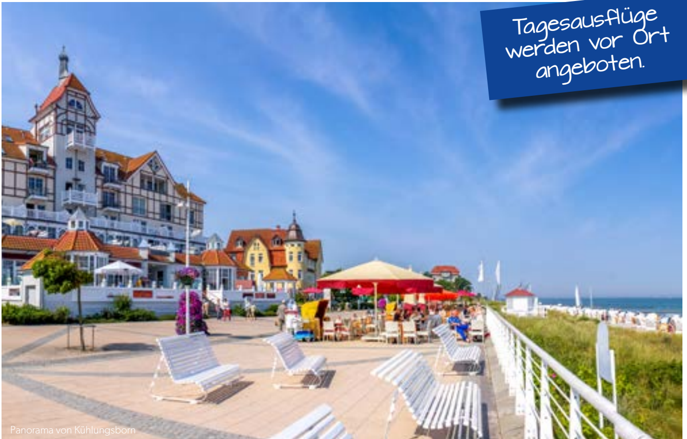
Panorama von Kühlungsborn

Kühlungsborn bietet Ihnen alles, was Sie zur Erholung benötigen: Endlose Sandstrände neben einer idyllisch gelegenen Promenade und der Ostsee im Hintergrund, die in den Sommermonaten zum Baden einlädt. Genießen Sie die kommenden Tage mit feinem Sand unter den Füßen, herrlichem Meeresrauschen in den Ohren und einem Ausblick zum Träumen. Auch gerade am Abend ist der Blick auf das durch die untergehende Sonne in bunten Farben getauchte Meer eine ideale Gelegenheit,