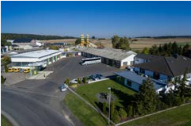
Betriebs Hof Standort Schwalmstadt