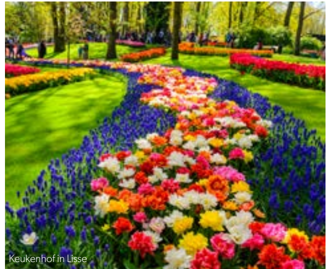
Keukenhof in Lisse