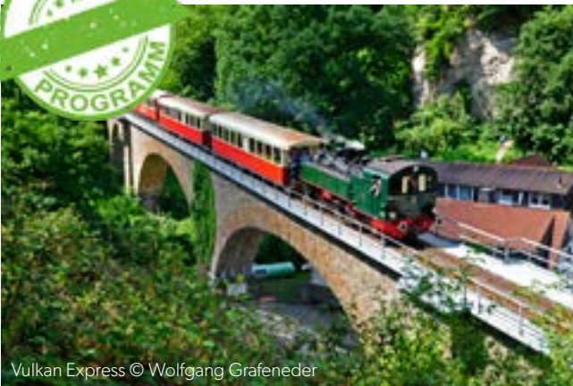
Vulkan Express

Das einzigartige Bahnerlebnis, welches Sie während der Fahrt mit dem Vulkan-Express erleben, wird heute durch eine Schifffahrt auf dem Rhein ideal kombiniert. Sie fahren rheinaufwärts mit dem Schiff der MS Beethoven von Bonn bis Brohl und genießen neben einem herrlichen Ausblick auf das umliegende Flussufer ein köstliches Mittagessen an Bord. Angekommen in Brohl gehen Sie auf eine historische Bahnreise durch das Brohltal der Eifel bis Engeln und wieder zurück, wo Sie wieder am Schiffsanleger von der MS Beethoven erwartet werden und Ihren Ausflug in Linz beenden.