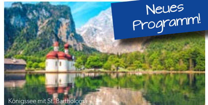
Königssee mit St. Bartholomä

Mit tollen Urlaubserinnerungen im Gepäck treten Sie die Heimreise an.