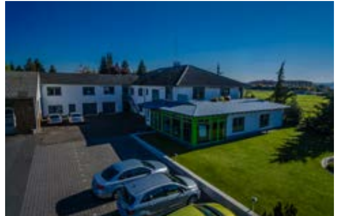
Standort Schwalmstadt, Bürogebäude