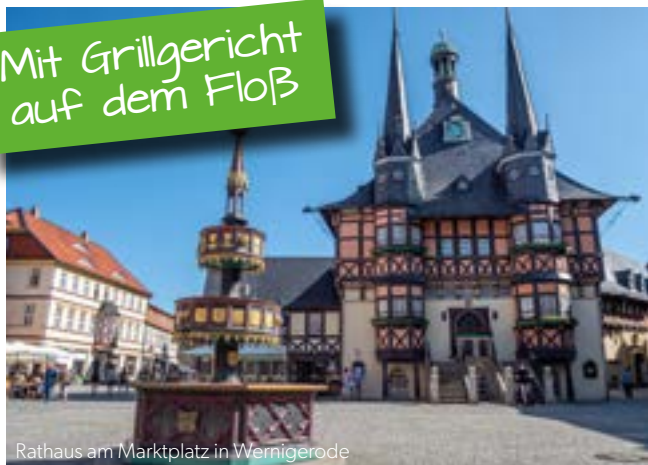
Rathaus am Marktplatz in Wernigerode

der malerisch mittelalterlichen Altstadt und Sie genießen den zauberhaften Charme bei einer Fahrt mit der Bimmelbahn.