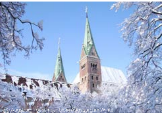
Dom Augsburg im Winter

Bummeln Sie durch die festlich beleuchteten Straßen, nachdem Sie das Schlemmerfrühstück im Hotel genossen haben, und im Anschluss die Heimreise antreten.