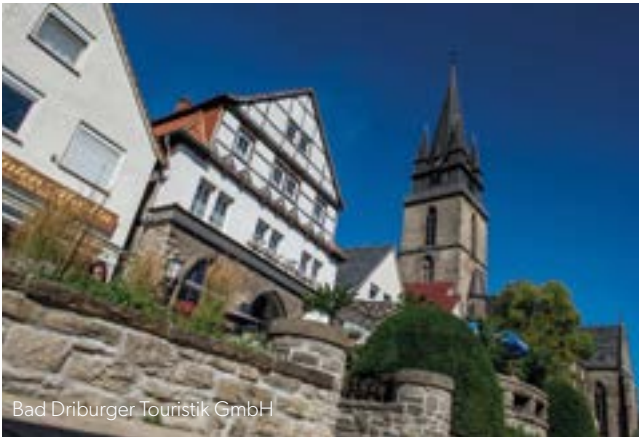
Bad Driburger Touristik GmbH

Mit blühenden Gärten und Parks, prächtigen Burgen und historischen Schlösser ist der Kurort Bad Driburg bekannt für die 725-jährige Stadtgeschichte mit ihren natürlichen Heilquellen, dem Naturmoor und jeder Menge kulturellen Angeboten. Nach dem Empfang in der Traditions Konditorei Heyse tauchen Sie in die Handwerkskunst ein und dürfen selbstverständlich von den süßen Leckereien kosten. Im Anschluss an das Mittagessen erkunden Sie die Innenstadt Bad Driburgs, stöbern im Leonardo Outlet und genießen Sie herrliche Atmosphäre in der Stadt. Zum musikalischen Ausklang werden Sie nachmittags wieder im Café Heyse mit Torte und Kaffee erwartet und erleben eine Vorführung der Wasserorgel.