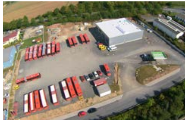
Betriebs Hof Standort Vellmar