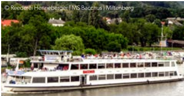
MS Bacchus | Miltenberg

Beginn der Schiffahrt um 15:00 Uhr ab/bis Miltenberg