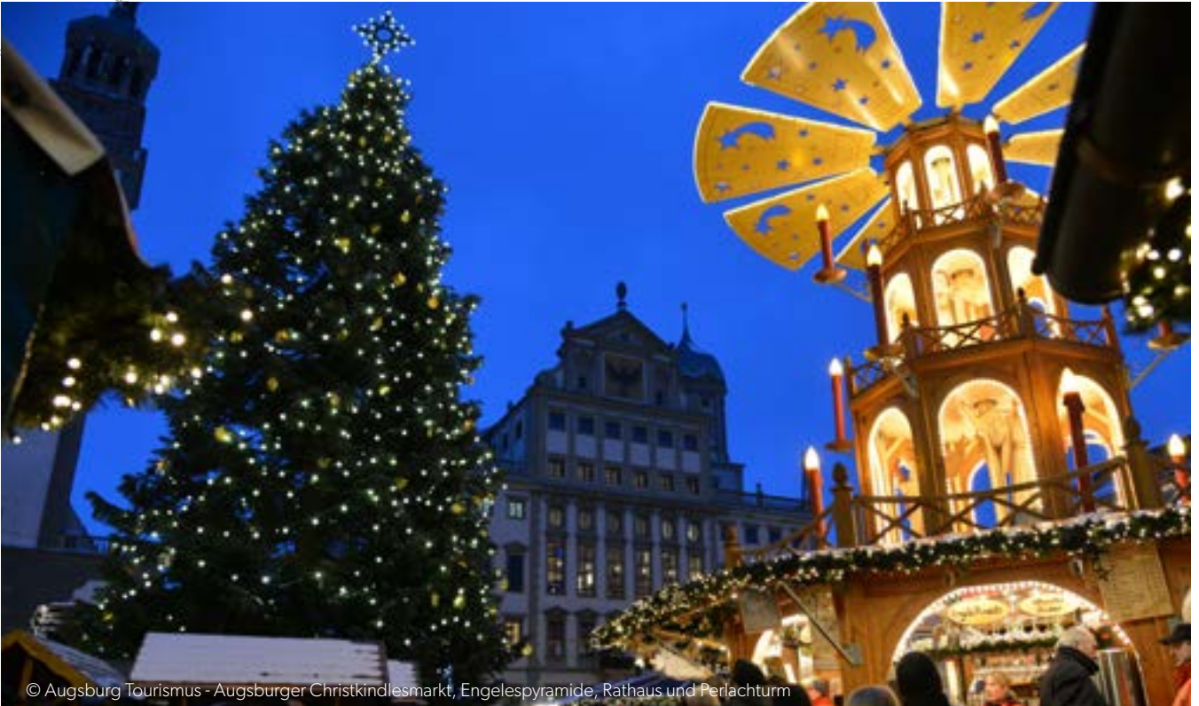
Augsburger Christkindlesmarkt, Engelespyramide, Rathaus und Perlachturm

Seit dem 15. Jahrhundert begeistert der Augsburger Christkindlesmarkt Groß und Klein mit handgemachten Weihnachtswaren, unzähligen süßen oder herzhaften Leckereien für jeden Geschmack und einer traumhaft romantischen Stimmung.